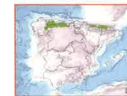
Esquerra: àrees de distribució de l'os bru als Pirineus i a la Serralada Cantàbrica.