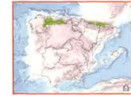
À gauche: aires de distribution de l'ours brun dans les Pyrénées et dans la Cordillère Cantabrique